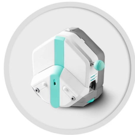
EasyPump 系列 (不可调压)