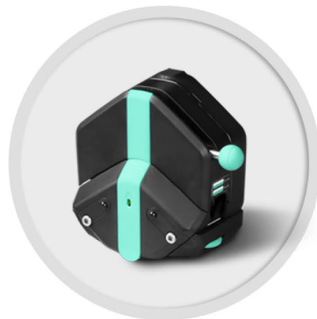
EasyPump-PPS 系列 (不可调压)